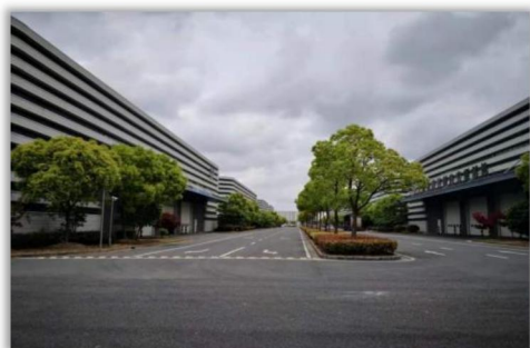
临港新兴产业园 D 区