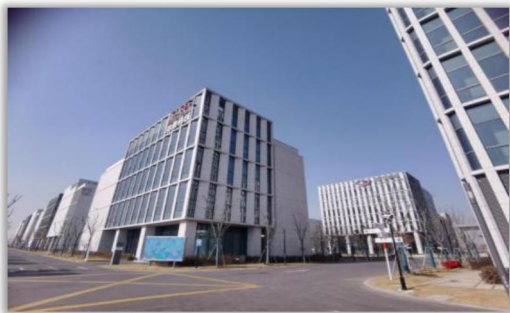
临港新侨新兴产业园

公司管理类型以非居住类物业中办公楼、园区、厂房及公众类场馆为主。目前公司管理的项目主要有：临港智造园一期（香樟园）、智造园二期（玉兰园）、智造园五期（文体中心）、智造园六期(生命科技园)、临港产业佳园、临港新侨新兴产业园、虹口新业坊、静安新业坊等 34 个各类项目，总面积约为 500 余万平方米。