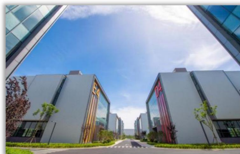
智造园六期·生命科技产业园